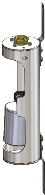
Рисунок 2: Датчик плотности с кронштейнами для монтажа на ДУ-А.2, ДУ-Б.2 (для РС).

Примечание: Если датчик ДП «сухой», т.е. не находится в топливе, то значение плотности от плотномера датчик уровня не использует для расчета средней плотности и ее значение остается равными «0».