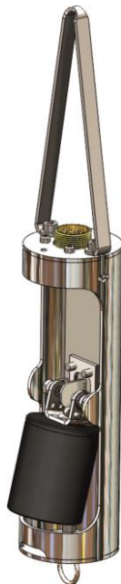
Рисунок 3: Датчик плотности с кронштейном для монтажа на ДУ-Б.2 (для РВС).