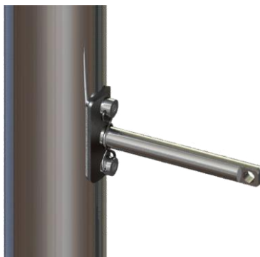
Рисунок 5: Кронштейн подвески ДП на штанге ДУ-М.