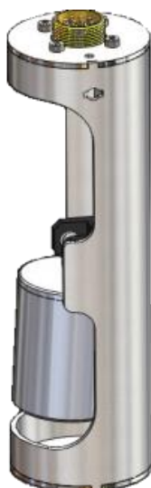
Рисунок 1: Внешний вид датчика плотности (базовый вариант)